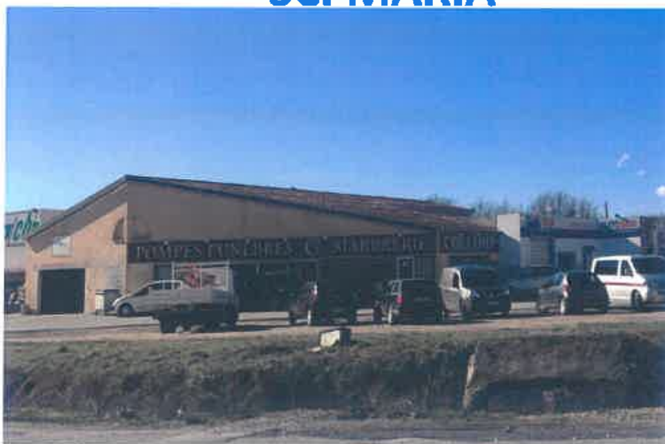
Centre Commercial Carrefour Chambarrot à Montauroux