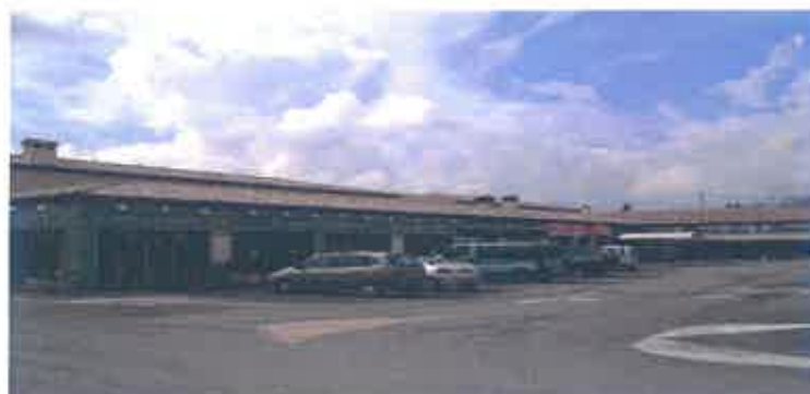
RD 562 Quartier la barrière 83440 Montauroux -2500 m 2