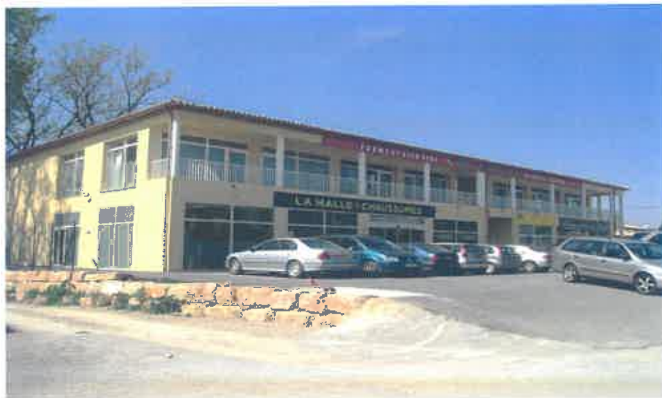
Rd 562 - quartier la barrière 83440 Montauroux